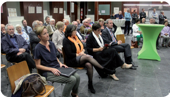
Opening tentoonstelling "WO I gelezen in zijn affiches"